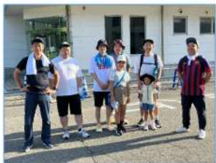
出発前の集合写真